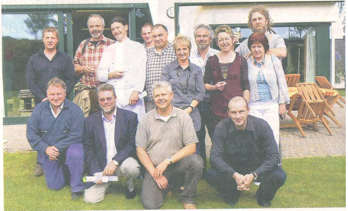
Cuisiniers, musiciens, photographes, comédiens, artistes: ils seront tous là pour et avec la Petite Plante.

Une vraie fête, parrainée par un "handicapé célèbre", Pascal Du-